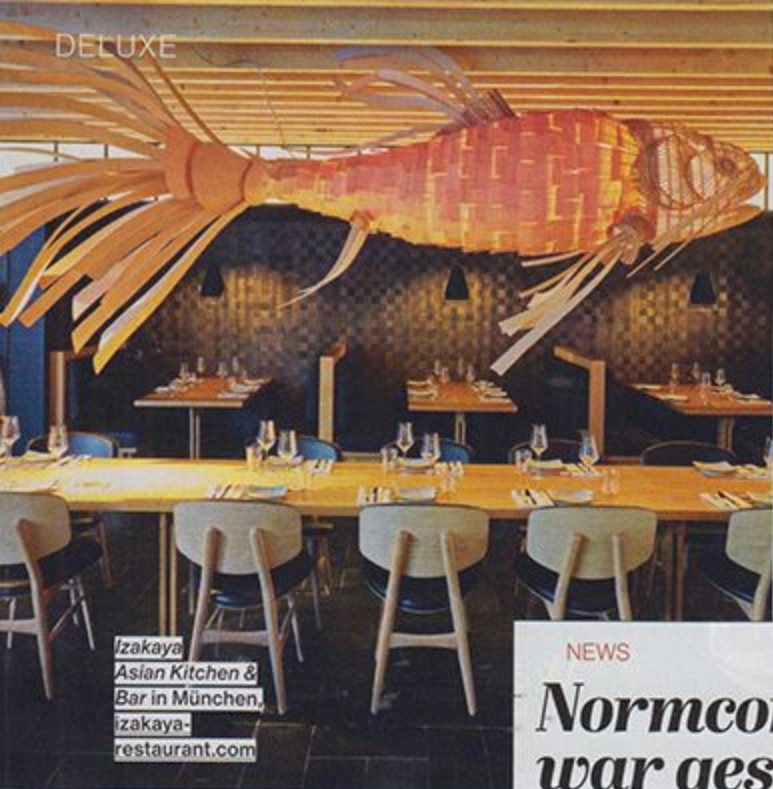
Izakaya Asian Kitchen & Bar in München. izakaya- restaurant.com